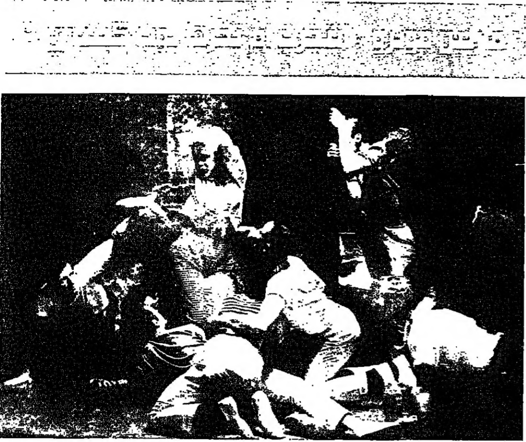
محبوبون بالجملة يصفون لثلاثين المشية لغوة وشيطة

ان السعادة كانت لها ثمرة محرمة. والسؤال الذي ما زال يُرعى بظلاله على النخلة الكبيرة ما يزال مشغلا: هل ماتت مارلين مونرو من حبها لآل كينيدي؟ ها ان العالم يرفض حتى اللحظة مبدأ «القول» النجاسة الذي حدث في ٤ اب ١٩٦٢. وما زالت الكتب تتواتر عن موت مونرو، محاولة ايجاد تفسيرات مختلفة له.